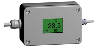
IN500As Elektronik-Box mit Display

IN500As inkl. Schutzrohr (Edelstahl); Druckluftanschluss (Schlauch außen Ø8 mm steckbar, R1/8" Gewinde im Schutzrohr); 3 m Verbindungskabel zur Elektronik-Box; Elektronik-Box mit Display